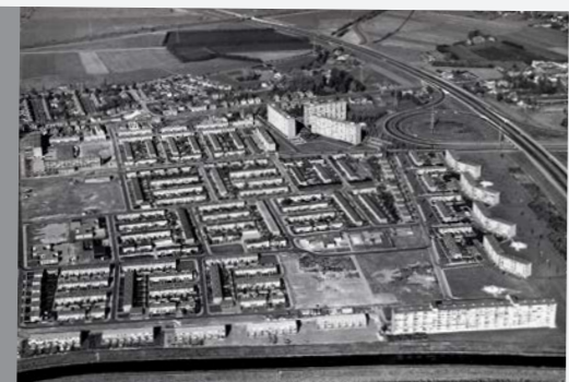
Woonwijk in Hintham