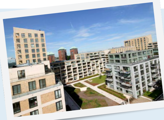
Andreas Ensemble in Amsterdam ontwikkeld door Proper-Stok

Heijmans bouwt voor het eerst een woonwijk en versterkt als weg- en waterbouwer ook haar positie in de woningbouw.