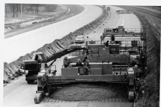
Beton Paver België

Heijmans viert haar 100-jarig bestaan en kijkt met vertrouwen naar de toekomst.