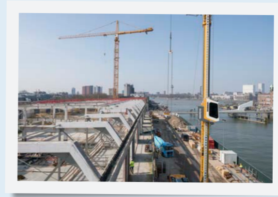
Fenixloods in Rotterdam

Kredietcrisis, ook Heijmans wordt geraakt. Kapitaalversterking en reorganisaties zijn noodzakelijk.