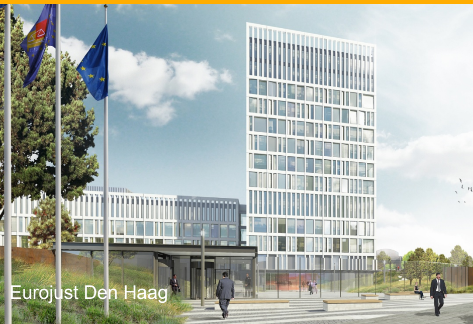
Eurojust Den Haag