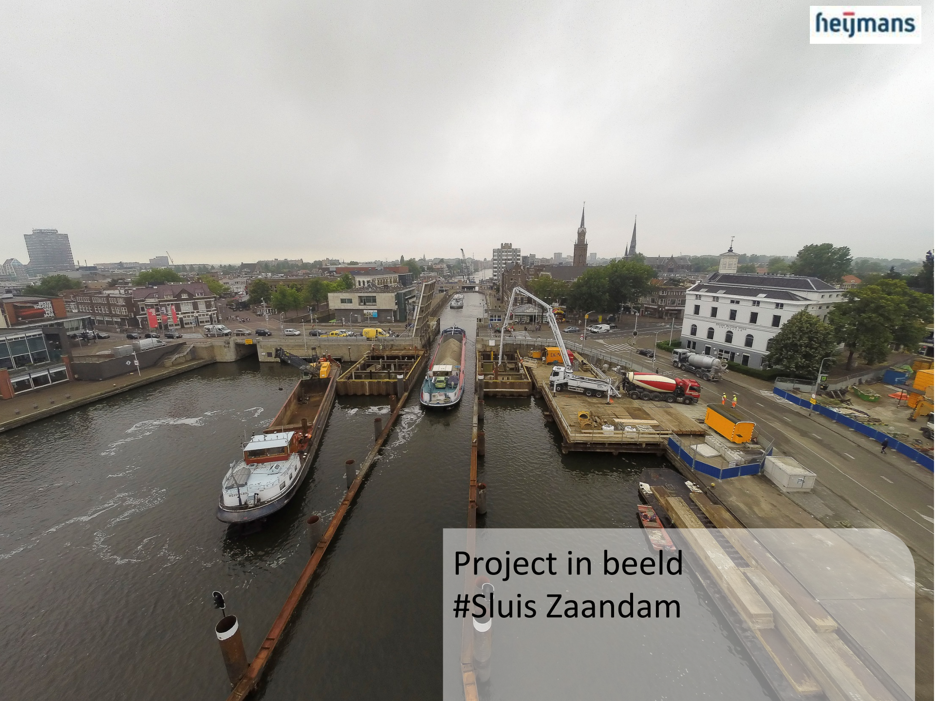
Project in beeld #Sluis Zaandam