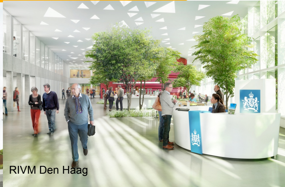
RIVM Den Haag