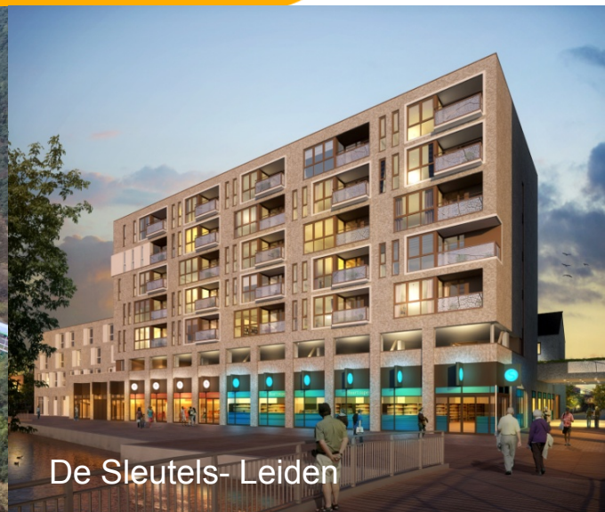
De Sleutels- Leiden