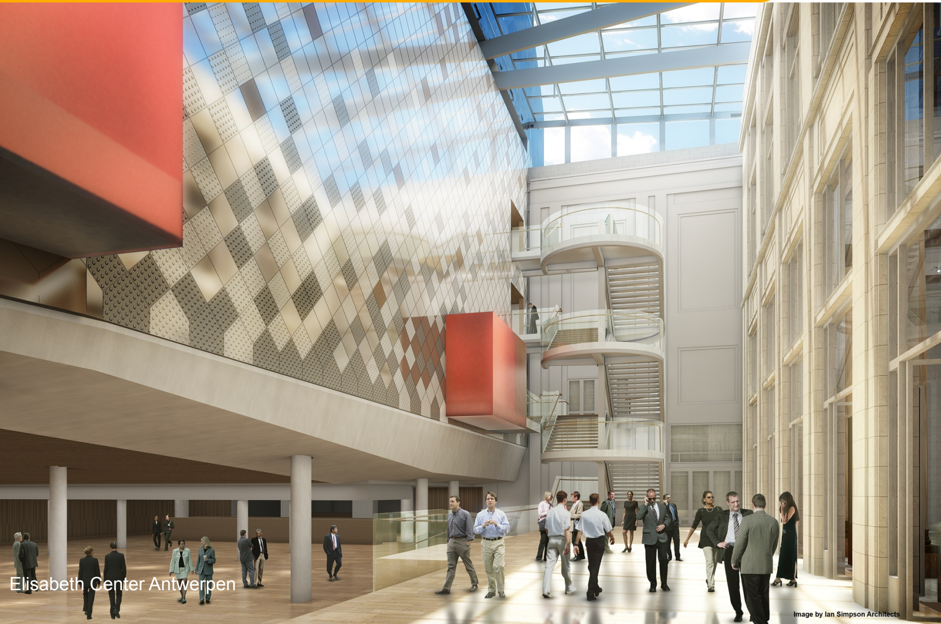
Elisabeth Center Antwerpen