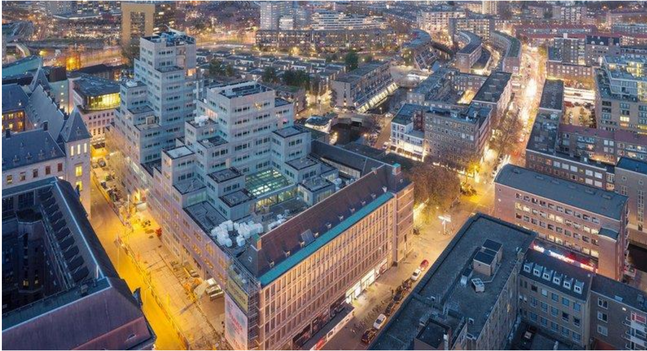
Opleveren Timmerhuis Rotterdam