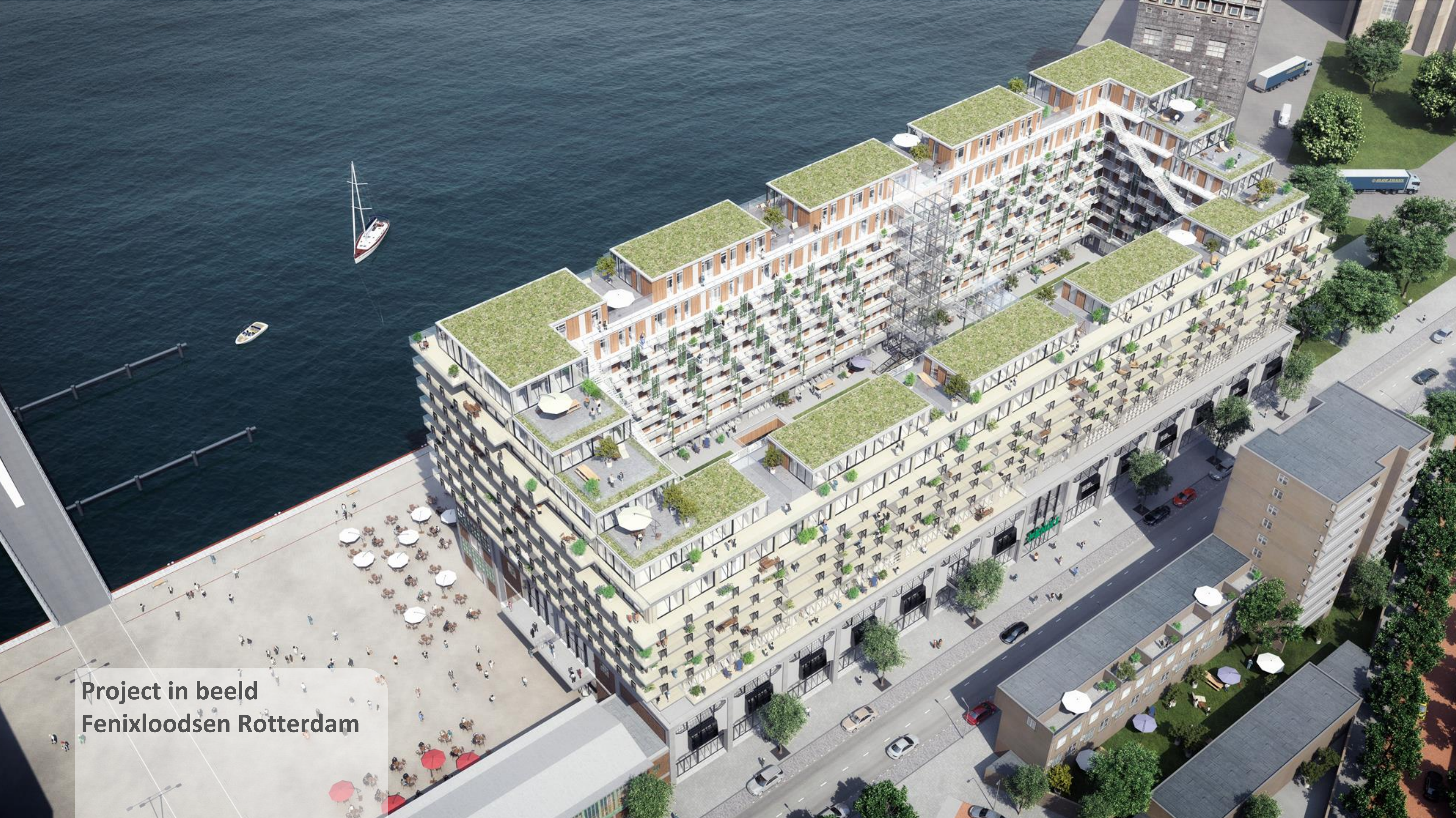
Project in beeld Fenixloodsen Rotterdam