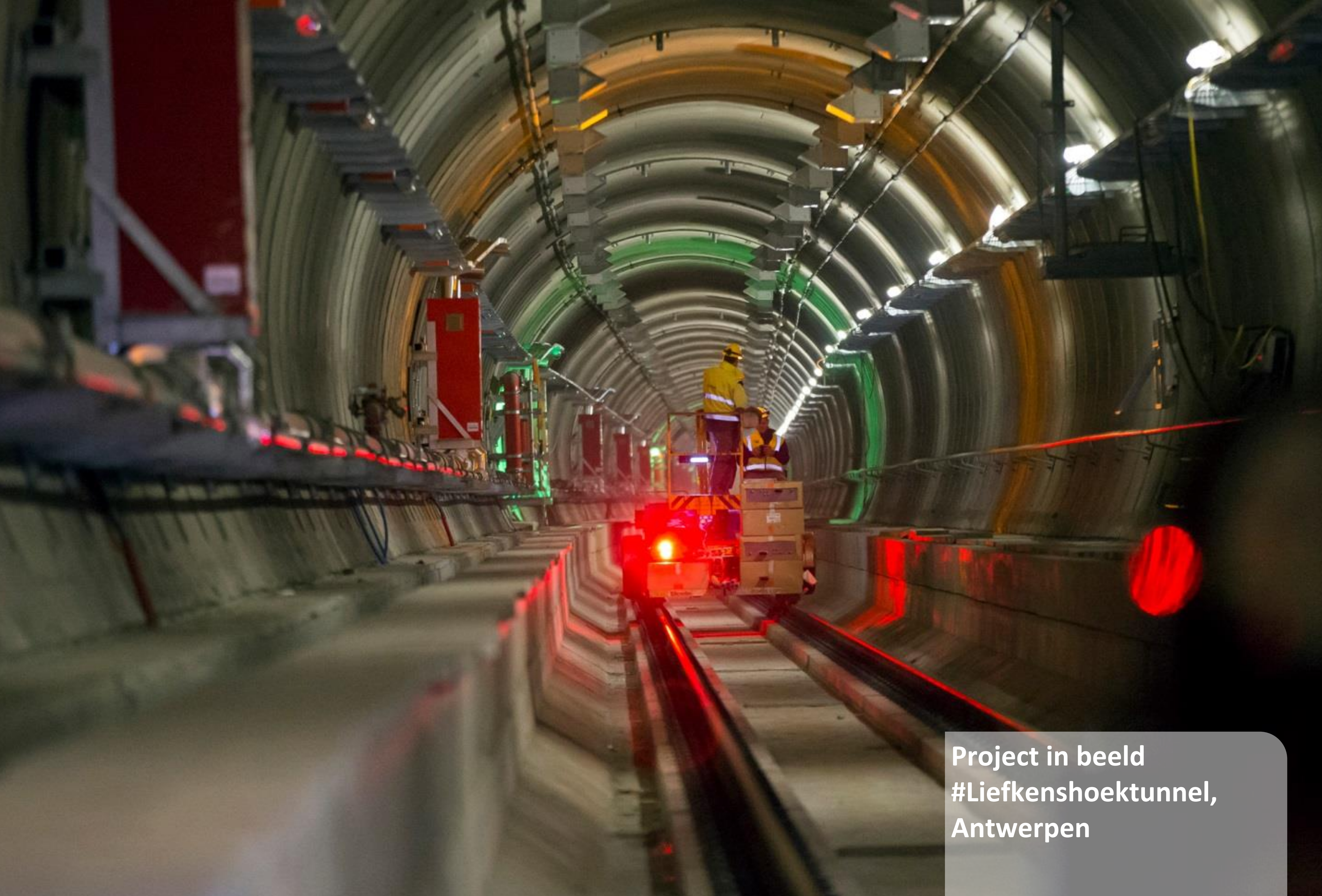
Project in beeld #Liefkenshoektunnel, Antwerpen