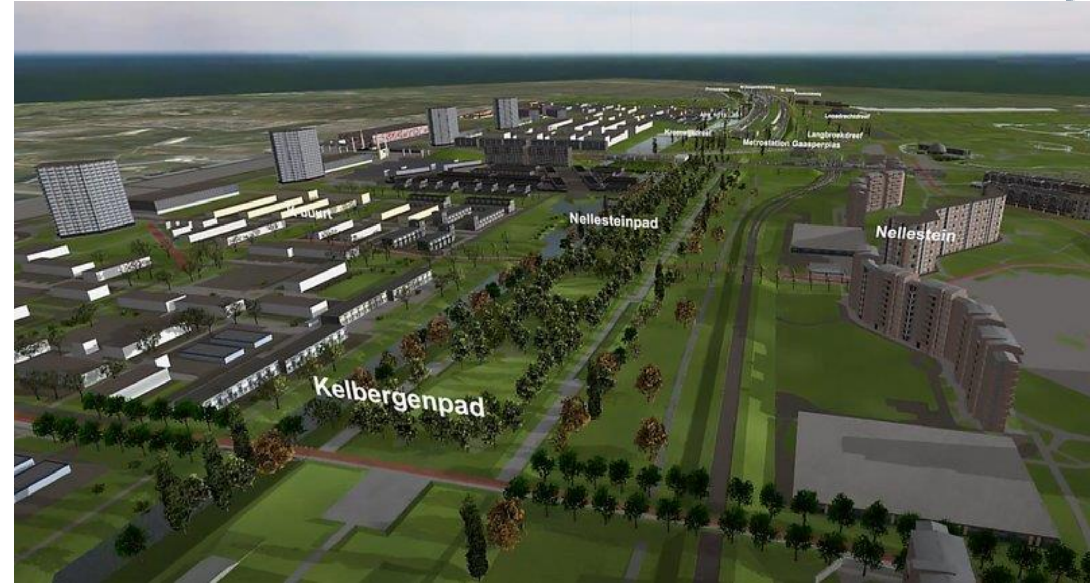
Start bouw A9 Gaasperdammerweg