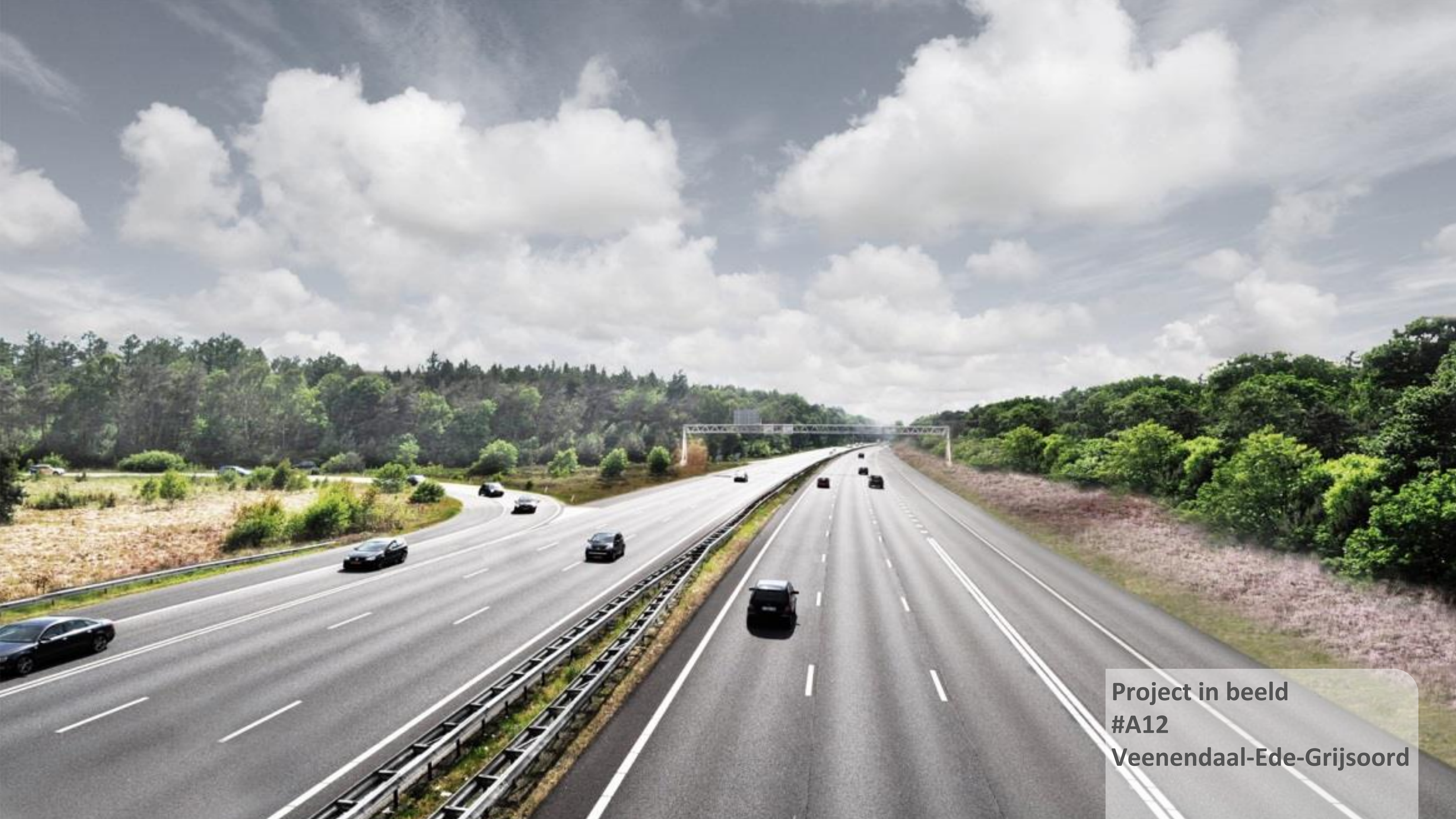
Project in beeld #A12 Veenendaal-Ede-Grijsoord