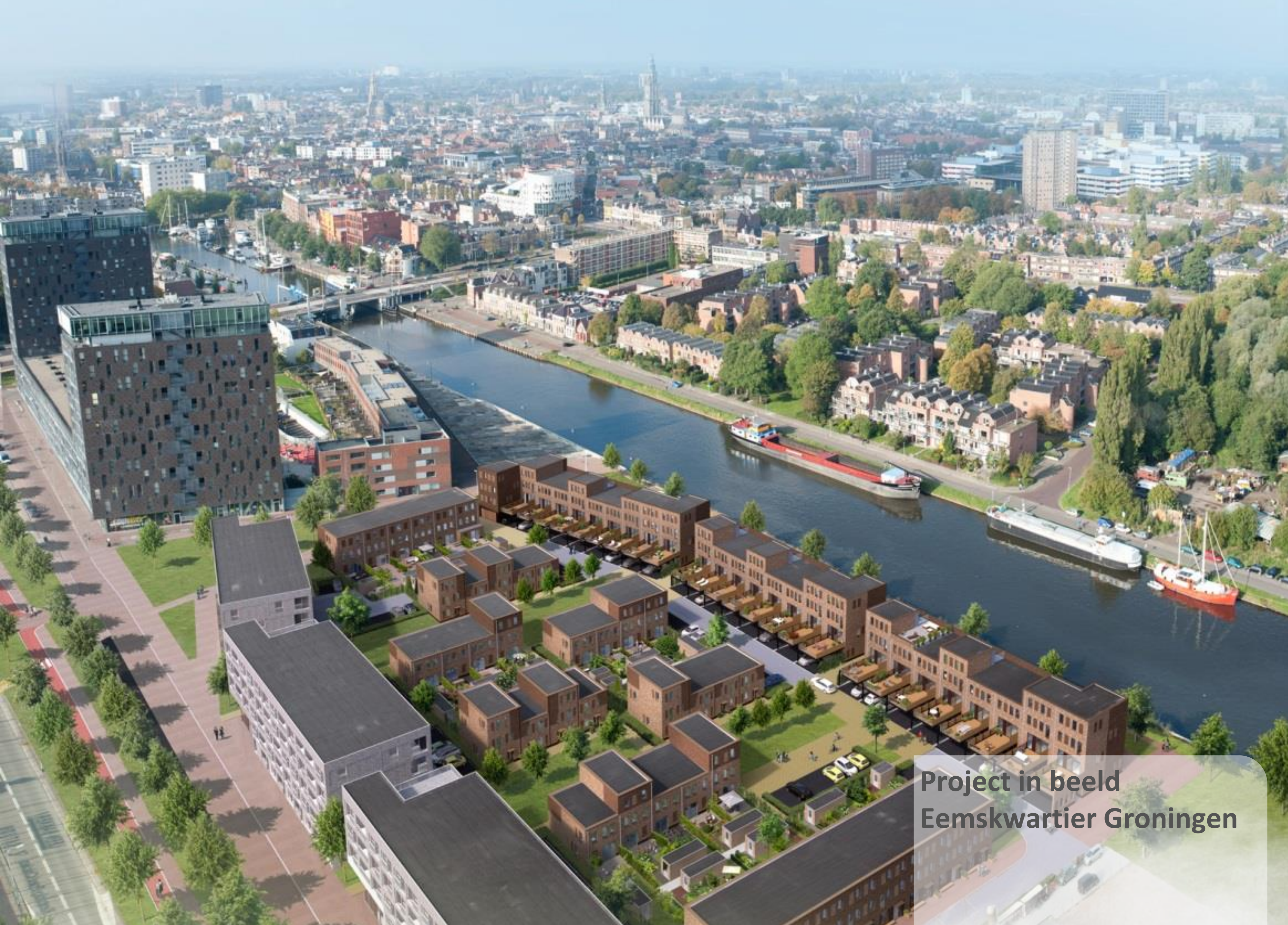
Project in beeld Eemskwartier Groningen