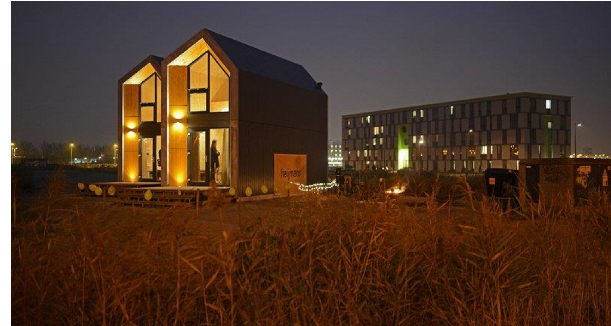
Heijmans One in productie