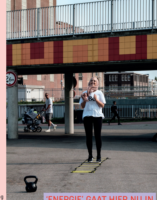
Sporten in De Verademing

'ENERGIE' GAAT HIER NU IN DE EERSTE PLAATS OVER DE ENERGIE VAN DE MENSEN!