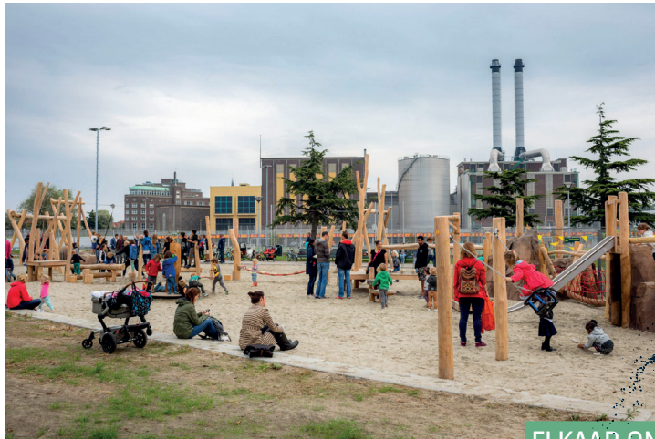
Speeltuin De Verademing