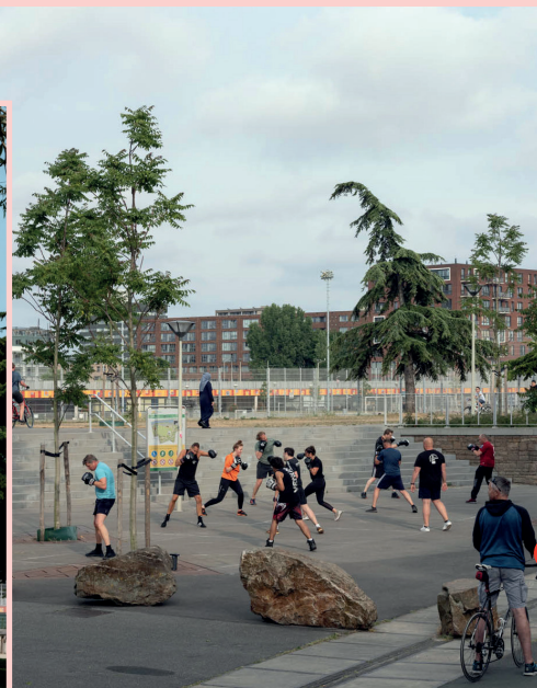
Sport- en spelmogelijkheden