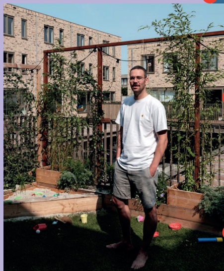
Dektuinen in Esperanto